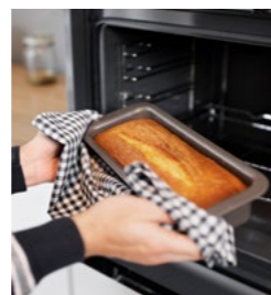
Fabricação de fogões