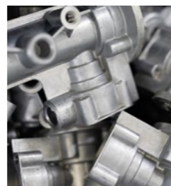
Componentes em alumínio para a indústria