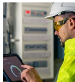
Painéis elétricos e geração de energia