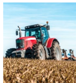
Máquinas e implementos agrícolas